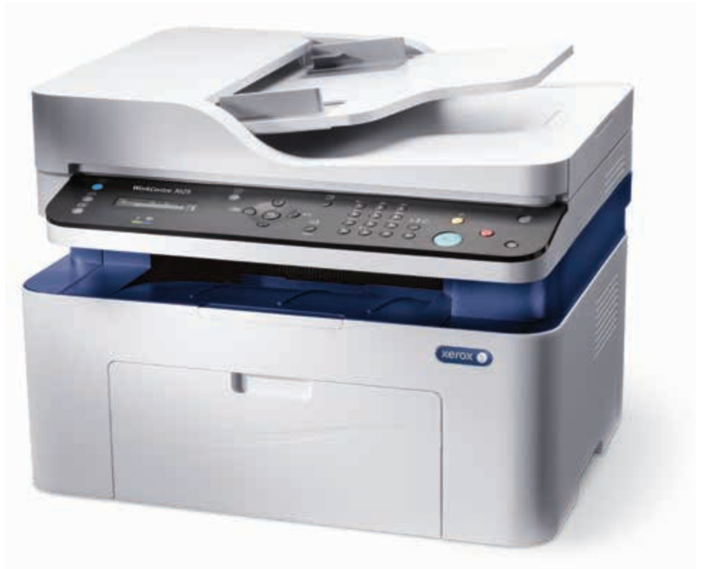
WorkCentre 3025. Copiere. Imprimare. Scanare. Fax.*

* Faxul și dispozitivul automat de alimentare sunt disponibile numai la WorkCentre 3025NI.